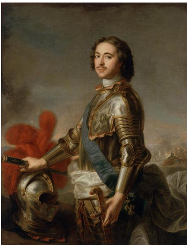
Натье, Жан-Марк. Портрет императора Петра I (1672-1725), 1717 год.