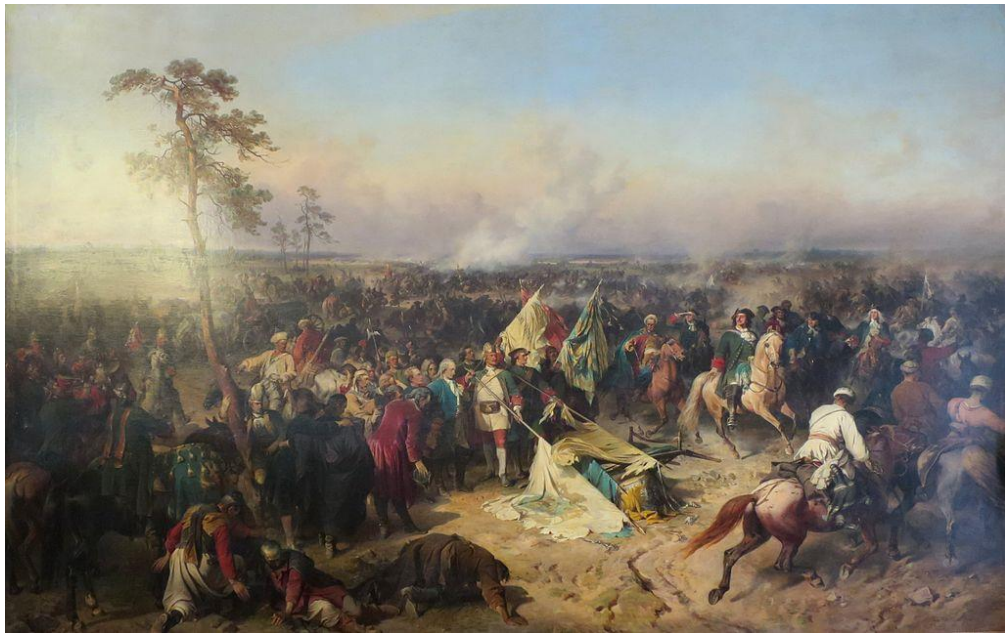
А.Е.Коцебу. Полтавская победа

Опираясь на знания истории и представленную картину, прокомментируйте, что дала России победа под Полтавой в 1709 году?