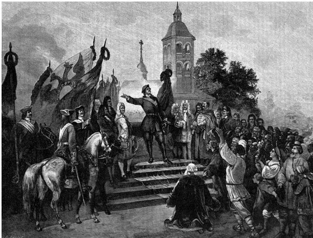
А.И.Шарлемань. Петр I объявляет Ништадтский мир на Троицкой площади в С.-Петербурге.

Б). На многофункциональной интерактивной панели с сенсорным экраном изображена картина А.И.Шарлемань «Петр I объявляет Ништадтский мир на Троицкой площади в С.-Петербурге».