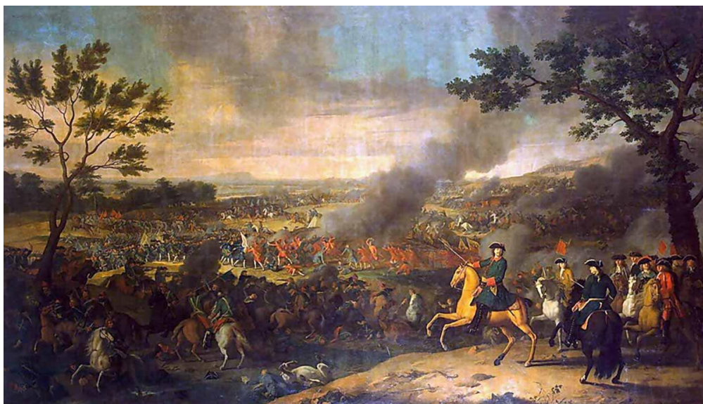
Каравак, Луи. Полтавская баталия, 1718 год.

На многофункциональной интерактивной панели с сенсорным экраном найдите ключевое слово из 7 букв, обозначающее монархическое государство во главе с императором ( по вертикали ) – (империя).